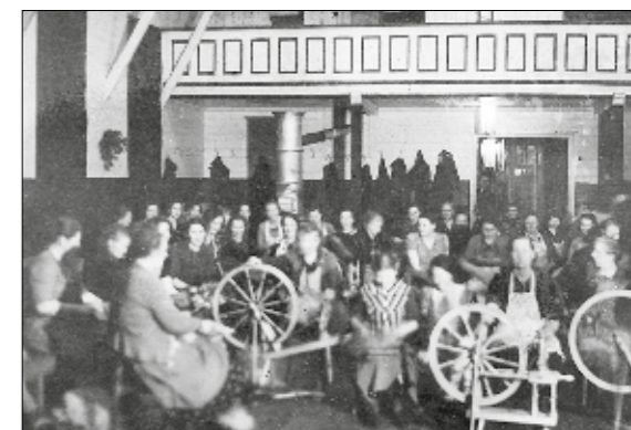
Hjemøens og Hellandsøyas helselag i full gang med å lage klær som skal sendes til soldatene i Finlandskrigen i 1939. Fra Festiviteten.

Stedets forsamlingslokale, Festiviteten, ble først bygget og tatt i bruk i 1925.