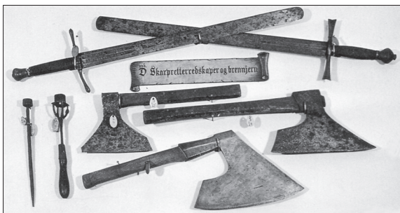
En del skarpretterredskaper ved Politimuseet i Oslo. Den nederste øksa var den som ble brukt ved de 12 siste henrettelser i Norge, og dermed også ved henrettelsen i Kabelvåg i 1862.