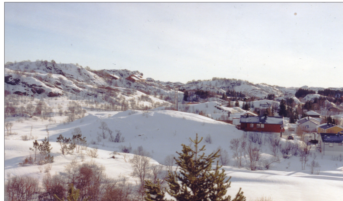
På sletten til venstre foregikk henrettelsen. Skafottet stod midt på sletten, og tilskuerne stod på haugene rundt. Bildet er tatt fra ungdomsskolen i Kabelvåg.

Torsdag 30. oktober 1862 strømmet folk til retterstedet i Kabelvåg. Det var strålende høstvær med klar, blå himmel og solskinn. Nattens lette snøfall hadde lagt et hvitt slør over marken. Snøen dempet lyden av jernskodde støvler mot treverket da soldatene marsjerte frem og stilte opp på den store plattformen. På de lave høydene rundt retterstedet var det allerede fullsatt med tilskuere av begge kjønn og i alle aldre. I hundrevis hadde de kommet reisende med båter som lå fortøyd på havna i Kabelvåg. Mange maleriske klesdrakter viste at der også var en god del sjøsamer. Retterstedet lå ved den gamle skytebanen, på sletten mellom Marithaugen og ungdomsskolen, bak byggefeltet i Ungdomsskoleveien.