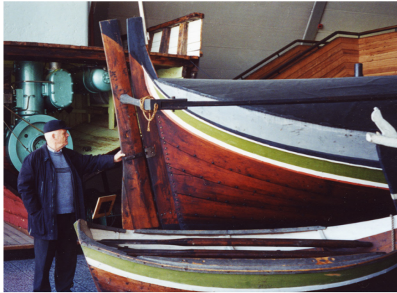
Fembøring i Båtmuseet på Bygdø, med styrevåle.

Posten og jeg måtte videre, og vi leiet en listerbaat, hvor vi fik spændt en presenning over midtrummet, saa postmesteren og jeg hadde en lun kahyt aa sitte i.