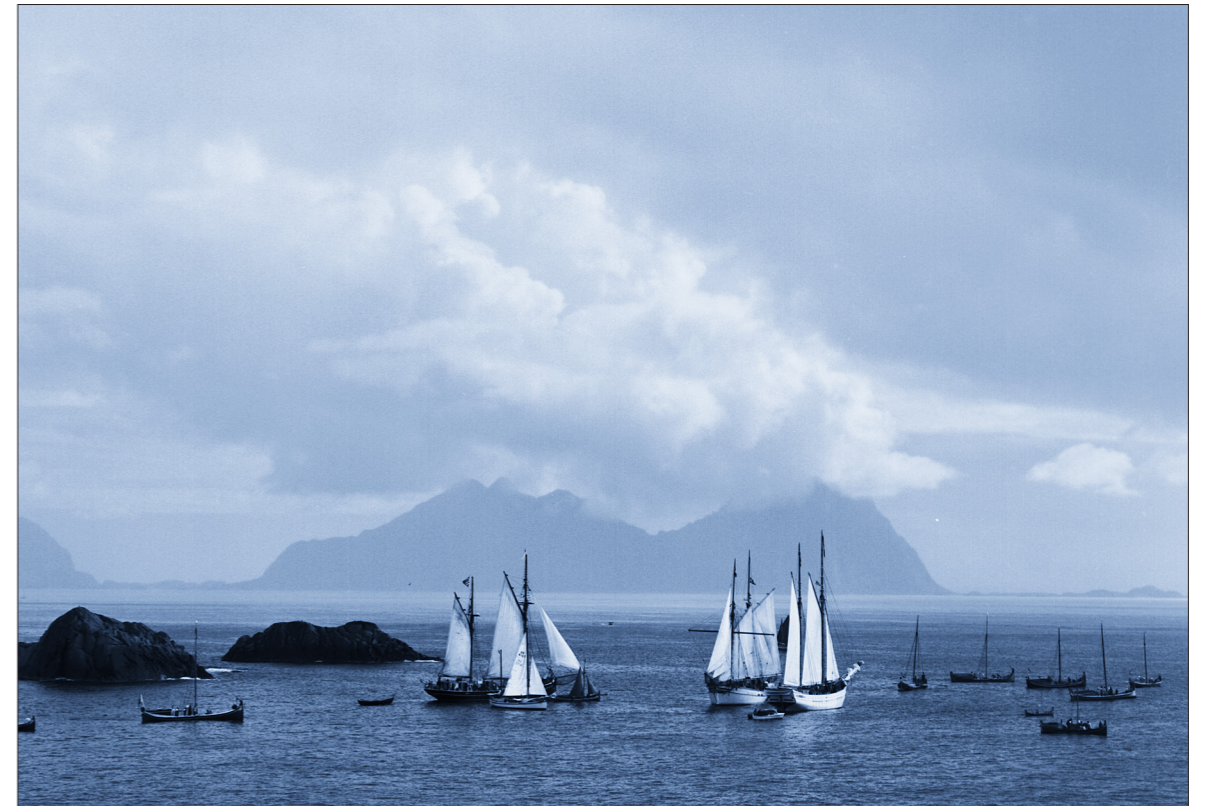
Nordlandsbåter seiler ut fra Kabelvåg under kyststevnet i 1998.

I det hele tatt ser det ut til at fiskerilegens viktigste hjelpemidler var amerikansk olje og opiumsdråper. Ellers bemerker dr. Armauer Hansen at i dårlig vær med landligge hadde fiskerne bare to former for underholdning. Det ene var kirken og det andre var å gå til doktoren.