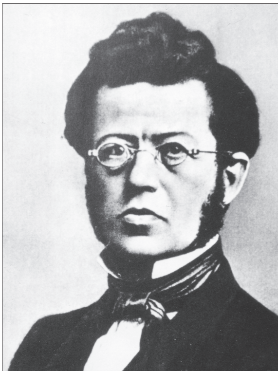
Samfunnsforskeren Eilert Sundt (1817-75) - sosiologiens grunnlegger.

andet forandring til det bedre, men i Tromsø stift en forandring til det verre. Hvorledes kan det forklares?"