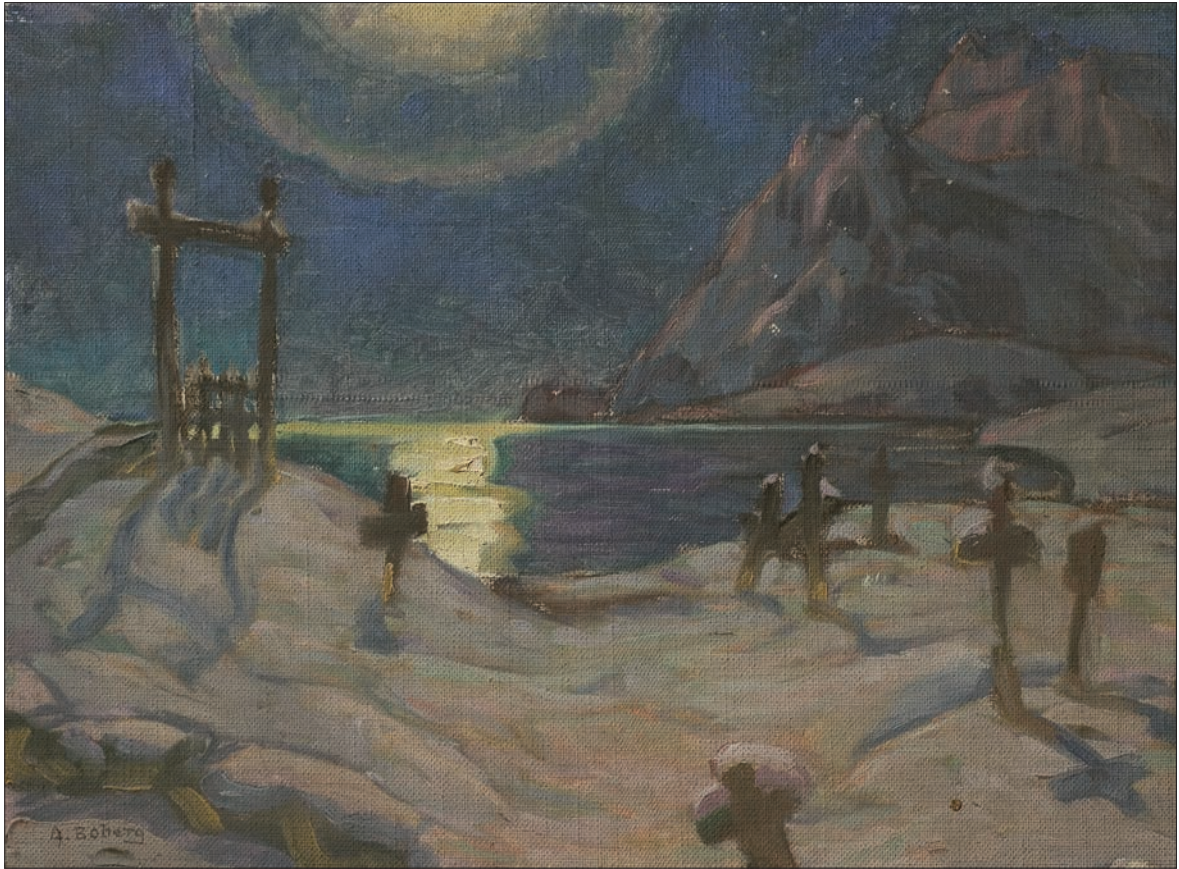
Kyrkogård i fjällen. Stockholm Nationalmuseum, NM 3439. Malt 1920, olje på dukmontert papp, 24 x 33 cm.