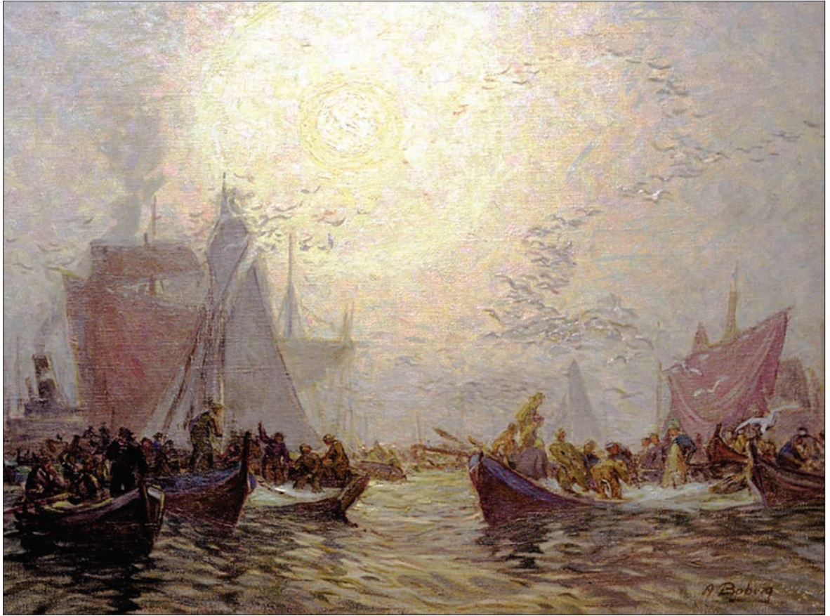
Notsteng . Frank A. Jenssen, Galleri Lofotens hus. Udatert, olje på lerret, 80,0 x 64,0 cm..