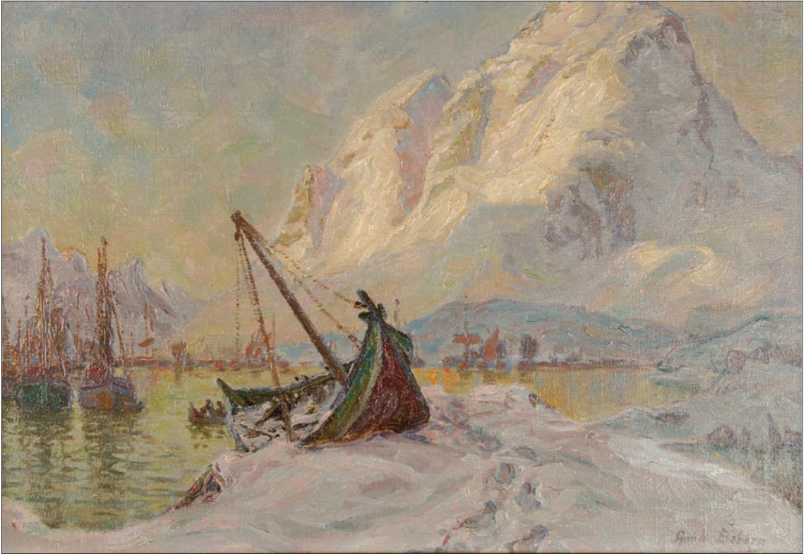
Reine 1912 . Privat eie. 40,0 x 60,0 cm.