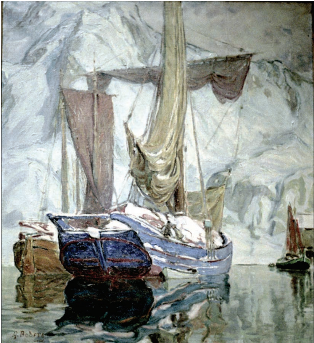
Den blå båten. Nasjonalgalleriet i Oslo. Malt mellom 1925-1929, olje på lerret, 59,5 x 53,0 cm.