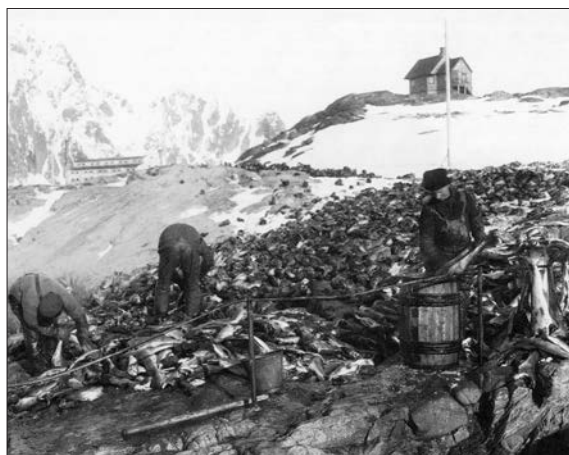
1924. Fiskearbeid med Boberghytta kneisende i bakgrunnen. Fra Lofotbilder 2 av Svein Smaaskjær.

Ifølge Ferdinand Bobergs nedtegninger i Handskriftsarkivet L 57. 29,2 skjer dette i november.