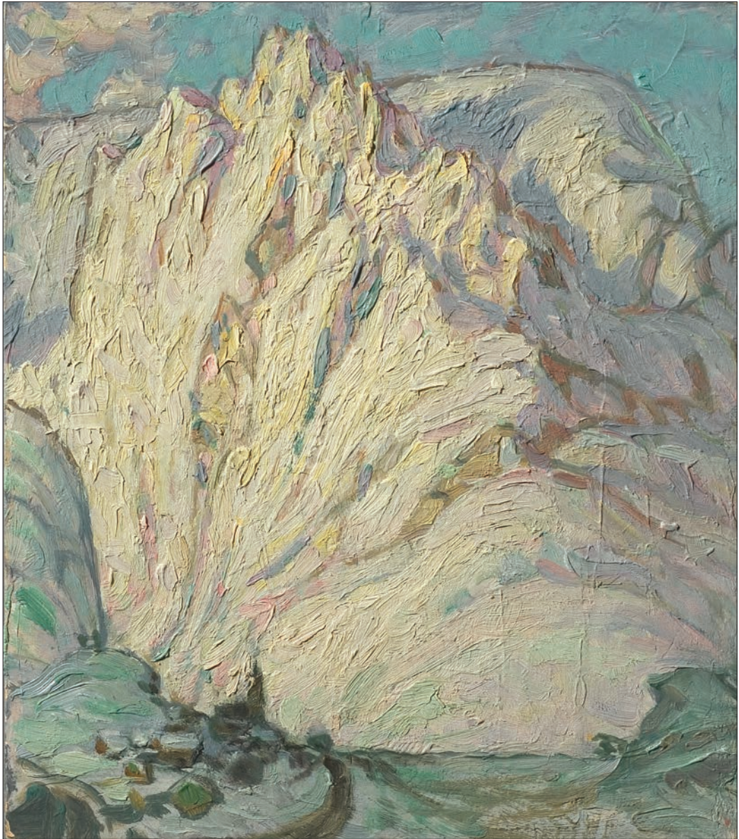
Lofotenstudie, Snöfjäll. Stockholm Nationalmuseum, NM 3450. Malt 1930, olje på papp, 24 x 21 cm.