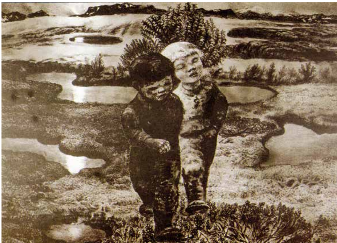
«Fylgje». To gutter går en vårnatt mot grensen. Månen langt inne i Russland speiler seg av i vann og bekkefar. Selv den minste pytt skjult i myr og mose får sin lille lyststjerne. Guttene er venner på vandring med hvert sitt mål, hvert sitt sinn. Den mørke ser ned, finner mening i lyng og pors. Den lyse har sin drøm. Våren og håpet er over ham.