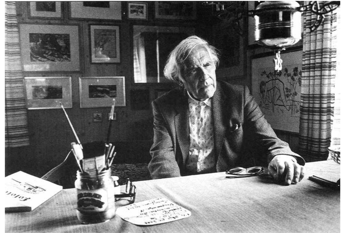
Kaare Espolin Johnson i stua i sitt kjære sommersted i Osen i Kabelvåg sommeren 1983.

I oppveksten måtte han ta farvel med sitt kjære Finnmark. For Kaare Espolin Johnson var det som å ta avskjed med livet. Man skal ikke flytte på barn, jeg hadde vanskelig for å slutte meg til noen senere, erindret han. Familien John-