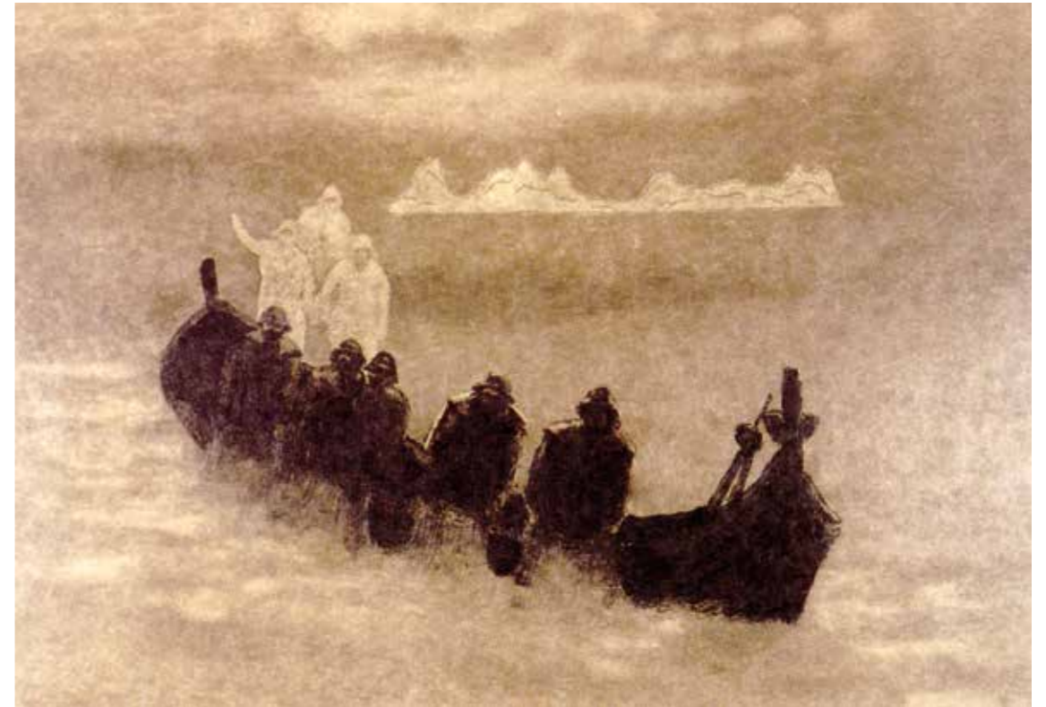
«Lysbroen». Lyset som budbringer er den innerste tanken i dette bildet. Gjennom skylaget siger halvlyset ned mot det lyse båtlaget. Det er kommet opp fra sjødypet for å minne oss om alle de fiskerne som fant sin grav i havet i de mange forlisene på Vestfjorden opp gjennom tidene. I den mørke båten arbeides det, ofte under harde vilkår, men gjenskinnet av lyset når også ned . til dem.