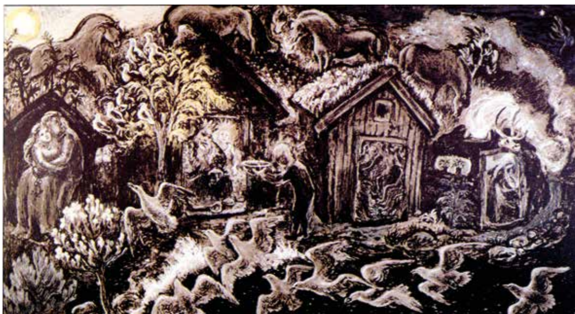
«Espehole». Når jeg i min barndom drømte om tipp-tippoldefars gård på Island, ble det ofte slik: Det var sommerfest på «Espehole», besøk av venner, hester og fugler fra havet. I ildhuset står en kvinne i røk og damp, hun lager maten. I gjestehuset ståker mannfolkene med sitt, skjenker seg mjød, skåler og avlegger brageløfter. Verten er konge, og til venstre er to glade i hverandre. I røken fra ildhuset skinner Nordstjernen klart og ensomt, det er sommernatt, og midnattsolen er gyllenrød. Jeg er lykkelig over at bildene fikk sitt hjem her i galleriet som en gjendiktning av husene i Vágar og gården på Island.