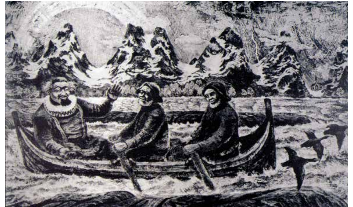
«Petter Dass». Da jeg laget dette bildet av Nordlands elskede dikterprest, tenkte jeg på solsiden ved hans lange reiser i sitt prestegjeld. En deilig sommerdag langs Helgelands kyst. Et truende tordenvær til høyre, men «han Petter» sitter trygt og godt. Han har regnbuen over seg og beretter for rorskarene.