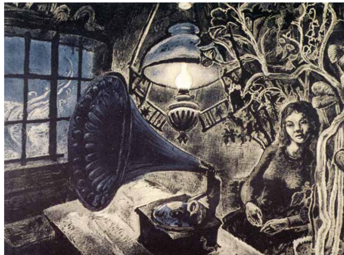
«Piken med grammfonen». Jeg kom en gang til en liten gard i Telemark. I våningshuset satt en ung, vakker pike, på bordet stod en gammel grammfon med en uhyre, grønn trakt. Nesten like stor var flokken av geranier som bøyet seg bak pikens mørke hode. Piken hadde en kjæreste langt borte i sneffellene. Det var ikke ofte han kom for å besøke henne, og hver gang han måtte tilbake, var grammfonen hennes gode venn. Når hun spilte sin kjæreste plate, fulgte hun i tankene ømt de vinterblå skisporene hans.