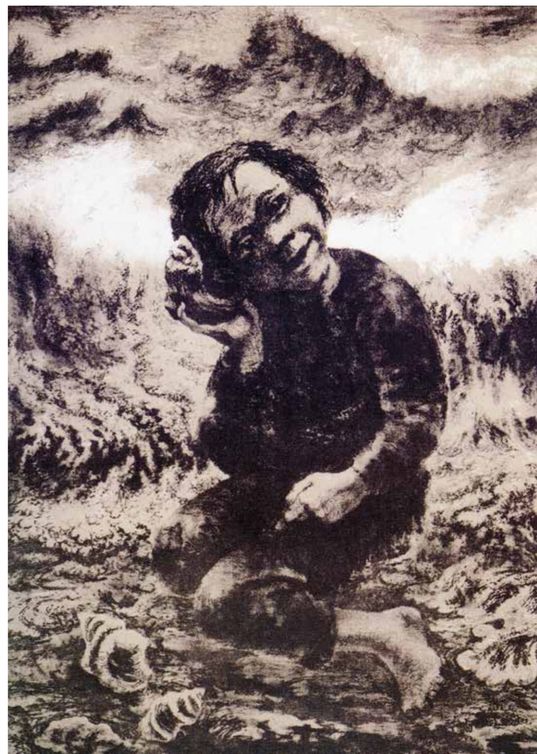
«Gutten med konkylie». I Finnmarken satt vi barn ofte nede i fjæra og lyttet til den hemmelighetsfulle sangen inne fra konkylie.