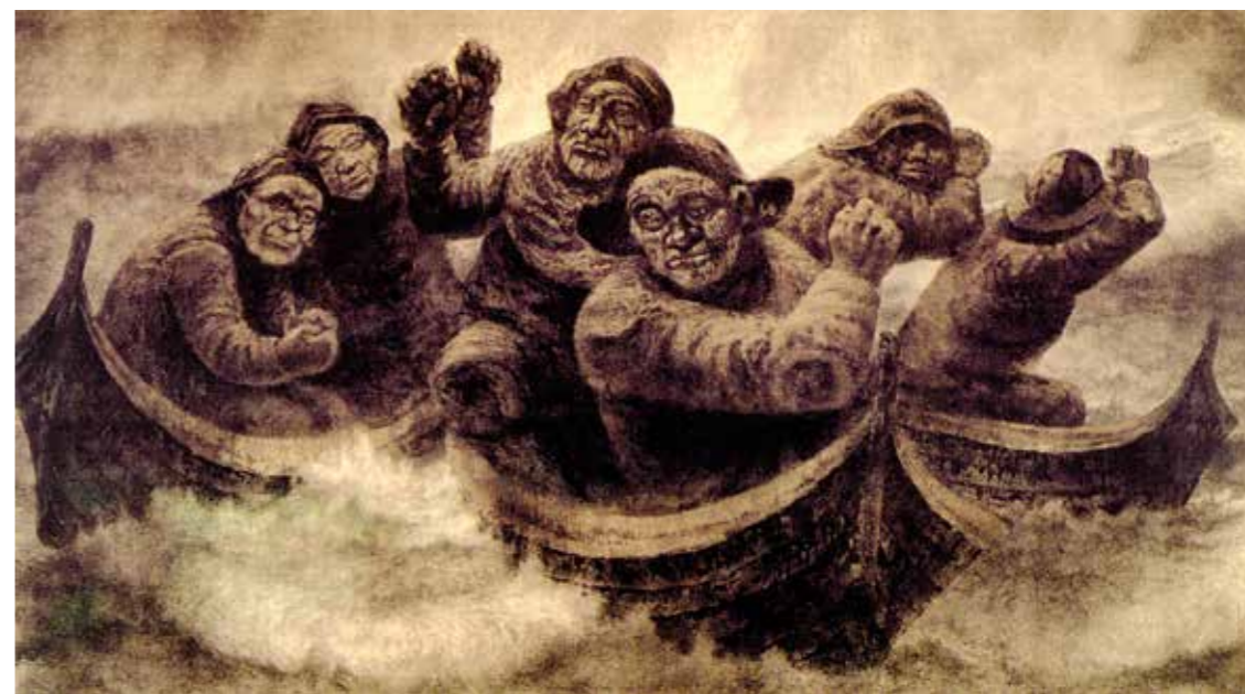
«Juksafiskere». Never og lovtter til værs i hissige tak, gammelkara er ivrige, - her skal det bli fesk. Og hvorfor kan ikke båtene ligge så nær hverandre at praten kan gå?