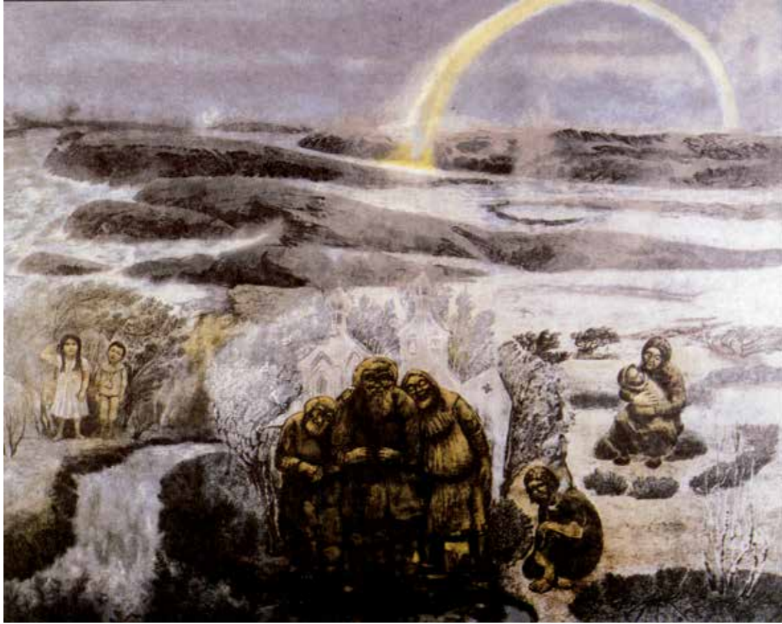
«Grenselandet». Det var i min lykkelige barndoms Eventyrland. I Øst-Finnmark ligger det, på sydsiden av Varangerfjorden. Her går havet i stiv kuling fra nord mot land, der reinmosen dekker de milevide viddene. Innover i bildet ligger Russland. I forgrunnen er den lille gresk-katolske kirken Boris Gleb ved grenseelven Pasvik, og til venstre over fossen står min søster og jeg som barn i bestefars skog. I de kalde, klare vinterkveldene med nordlys og stjerner kunne vi, når vinddraget kom fra sydvest, høre alle sølvklokkene i kirken. Om sommeren lå det merkelige finnmarkslyset over oss.