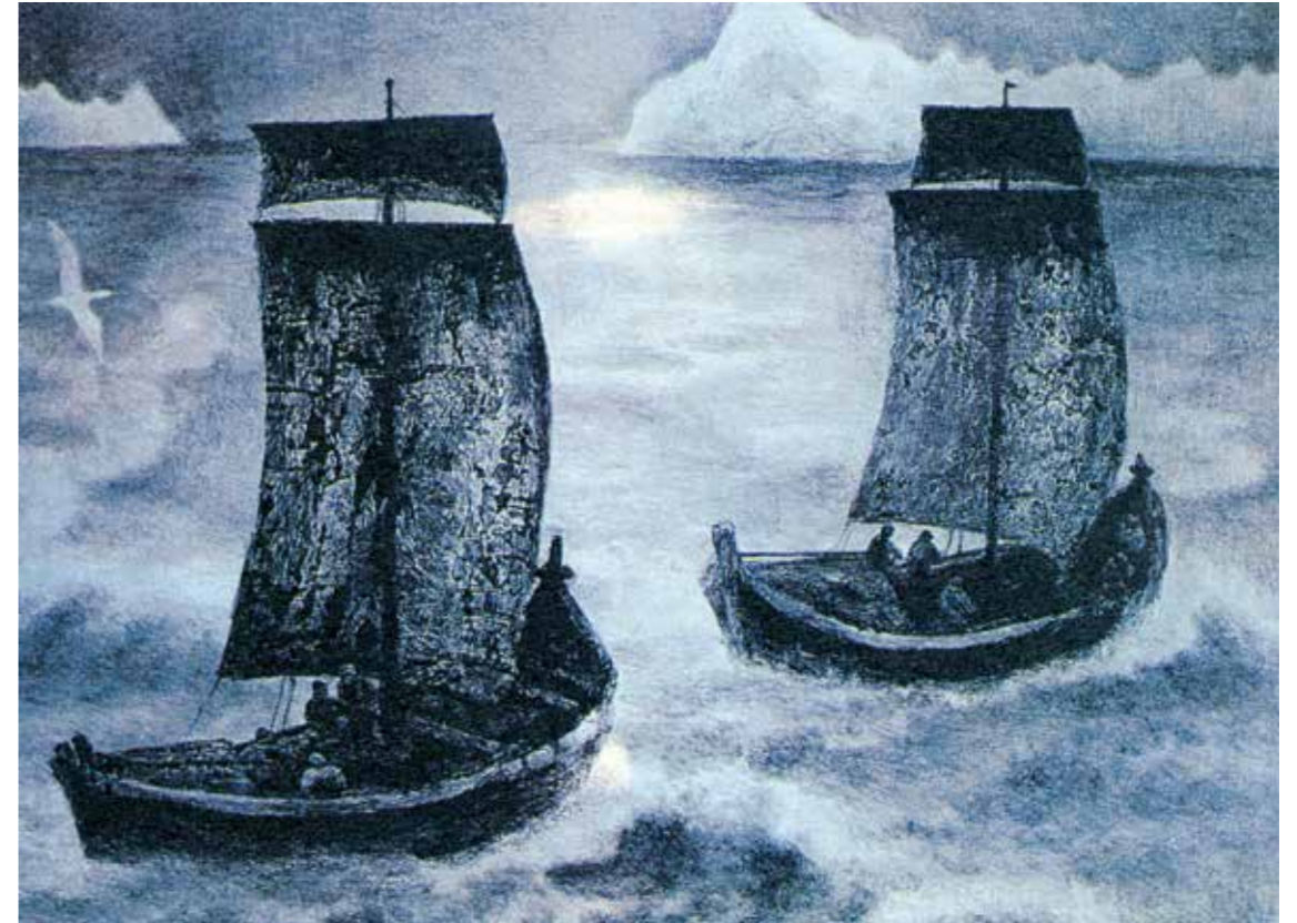
«Hjem til Vågar». I solgangsbrisen kommer fembøringene hjem til Vågar. Bak ligger Lofot-fellene, og mektig ruver Vågakallen i soldisen. Vågar het det første urbane senteret i Nord-Norge. Det stammer fra middelalderen og graves nå frem i området rundt galleriet. Det var et livlig handelssted. Interessante funn er gjort, og det vil foretas arkeologiske utgravninger i flere år fremover. Båtene den gang hadde stor likhet med de to fembøringene fra nyere tid som er på bildet.

Kaare Espolin Johnson inntar en særstilling i norsk billedkunst. I kraft av sitt dårlige syn og sin følsomhet for naturen og menneskene, lot han lyset stige ut av mørket. Det skimrende lyset, ved hjelp av stoppenål, barberblad og tannbørste. Han Espolin er borte nå, borte fra denne jorden. Men ånden hans rusler fortsatt like stødig over landet her nordpå. Overalt der havbåra bryt, i dragsuget langs Nykenes fot, under Vågakallens mektige neve, midt i blant oss alle sammen. Legg derfor øret til konkylien, og du vil høre åretakene fra «Peder på Røsthavet», «Roerne», «Himmelskipet».