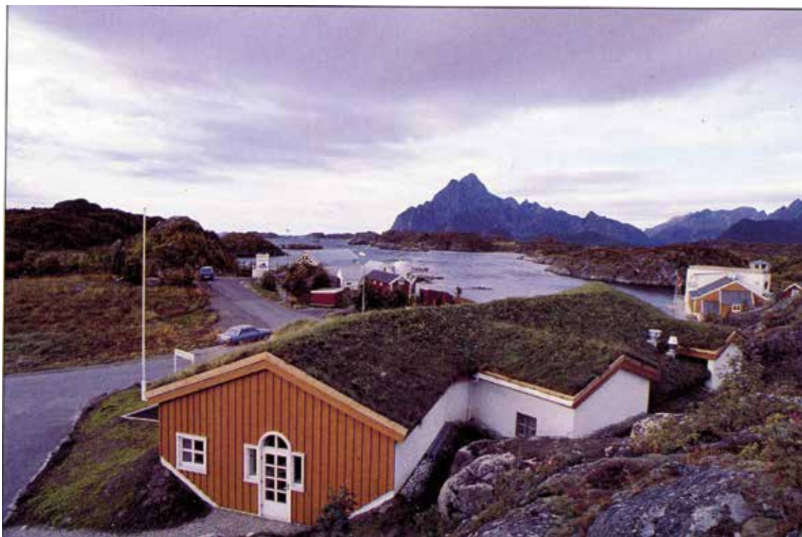
Utsikt mot Vågakallen. I forgrunnen Galleri Espolin i Storvågan, Kabelvåg.

den styrke av med-delelseskraft og skjønnhetsglede. Det var noe i dem som gjorde at de tonet i en lenge etter at selve synsinntrykket var borte.