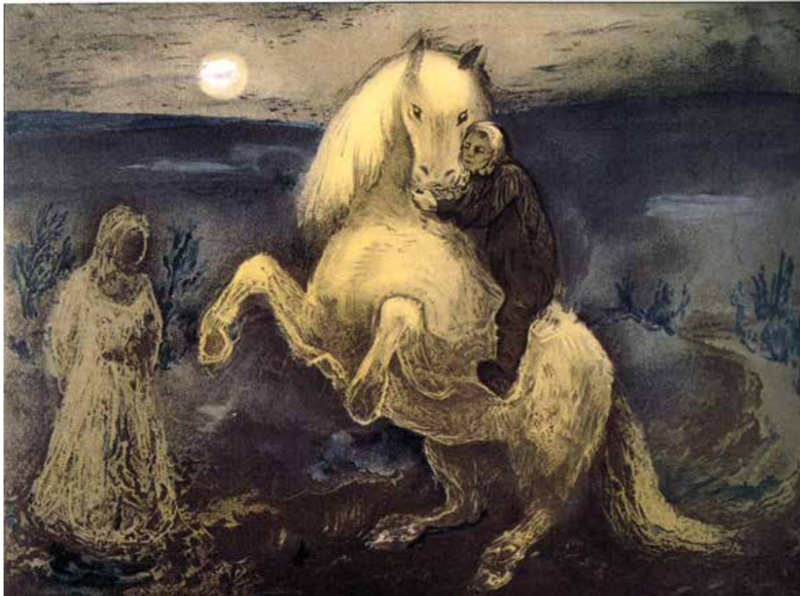
«Den hvite besten». Den som ser gjennom hestegrimen en jonsoknatt, ser huldra, sier de i Telemark.