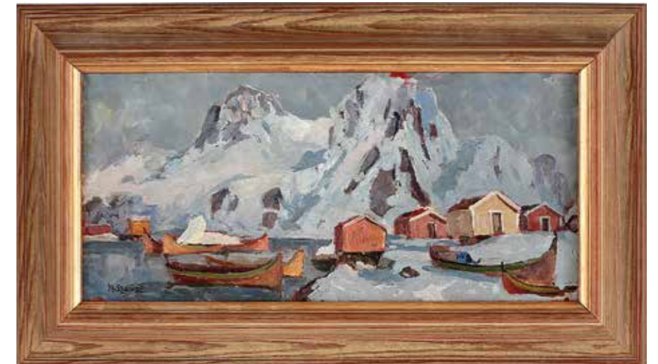
Motiv fra Lofoten. Halfdan Hauge.

lekar. Den storsta var femboringen, som kunde båra ett helt litet hus mellan relingarna, ett hus som också kunde lyf-tas av och sattas i land. Man seglade nordlandsbåtarna med råsegel: det kunde se ut som på vikingatiden nar en fiskeflotta narmade sig land.