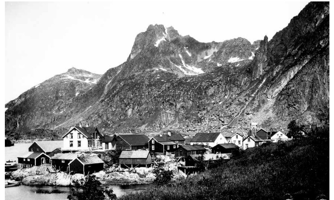
Svinøya sett fra Gunnarholmen juni 1905. Gunnar Bergs atelier til høyre i bildet.

var i det hele en ivrig og arbeidsom student og utnyttet tiden i Düsseldorf godt. Han var bl.a. spesielt interessert i anatomiundervisningen og utviklet seg til å bli en god portrett-tegner.