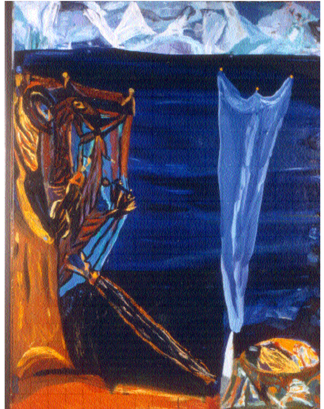
Nord, 1987, olje. 150x115.