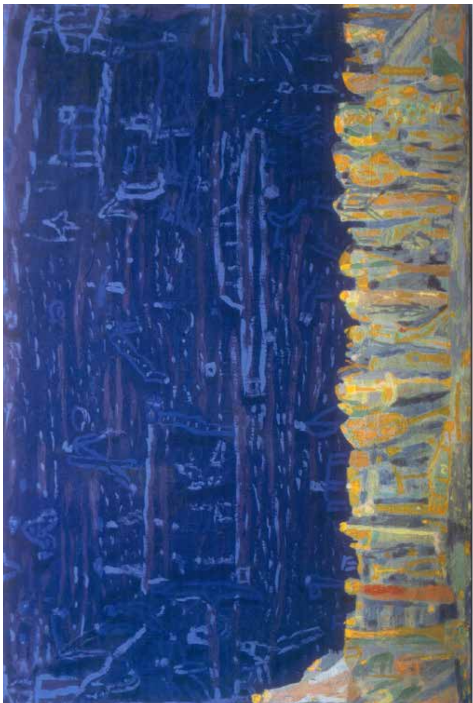
Oppdrag - 1991 - Acryl - 81x120