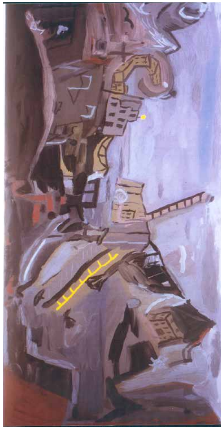
Landskap - 1988 - Acryl - 61x120