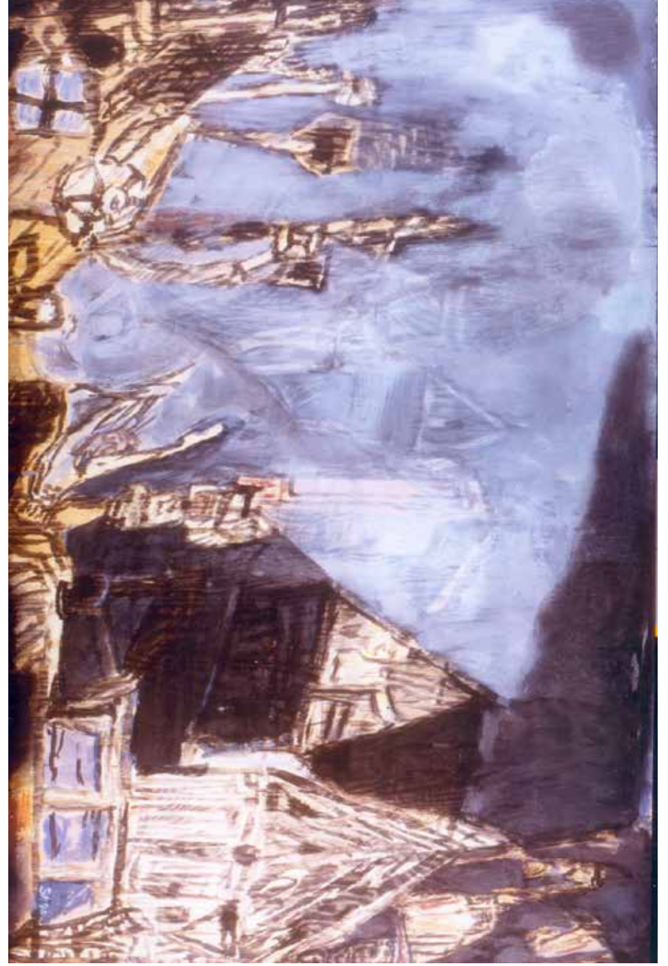
Historien - 1990 - Acryl - 81x122