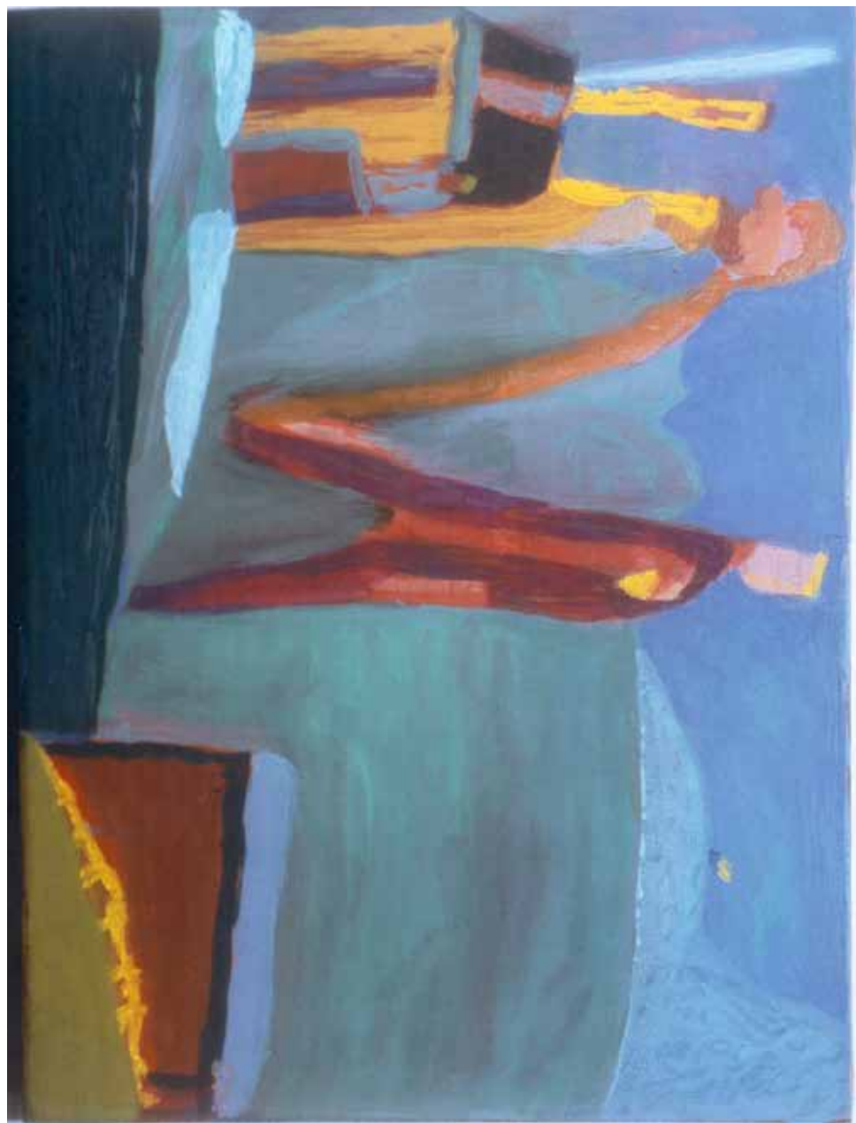
Vinter - 1994 - Acryl - 45x50