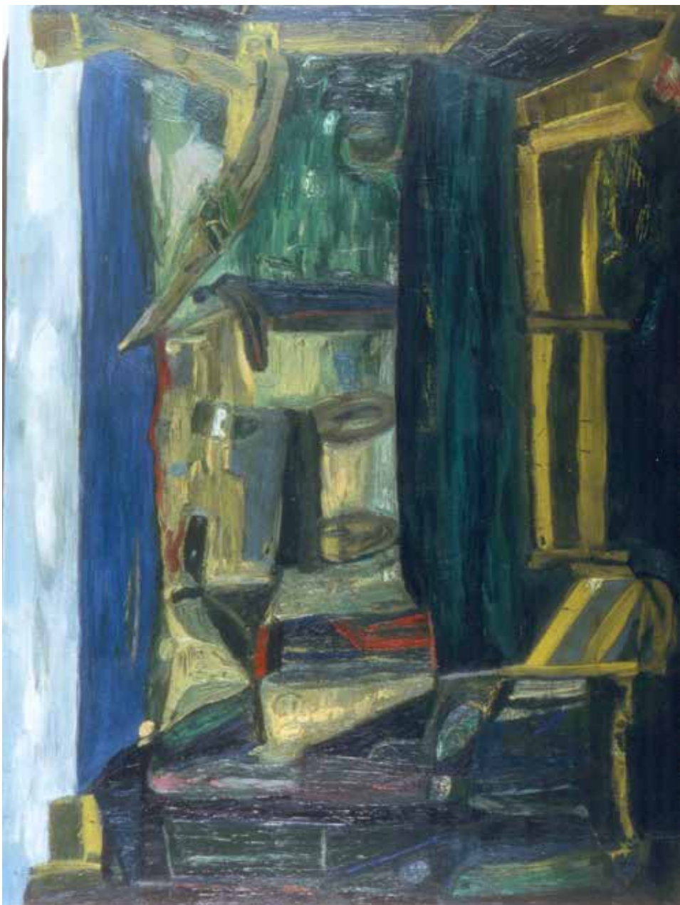
Strand, 1988, olje. 90x120.