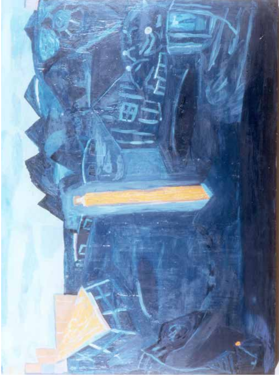
Lyset kommer tilbake - 1988 - Olje - 81x121.