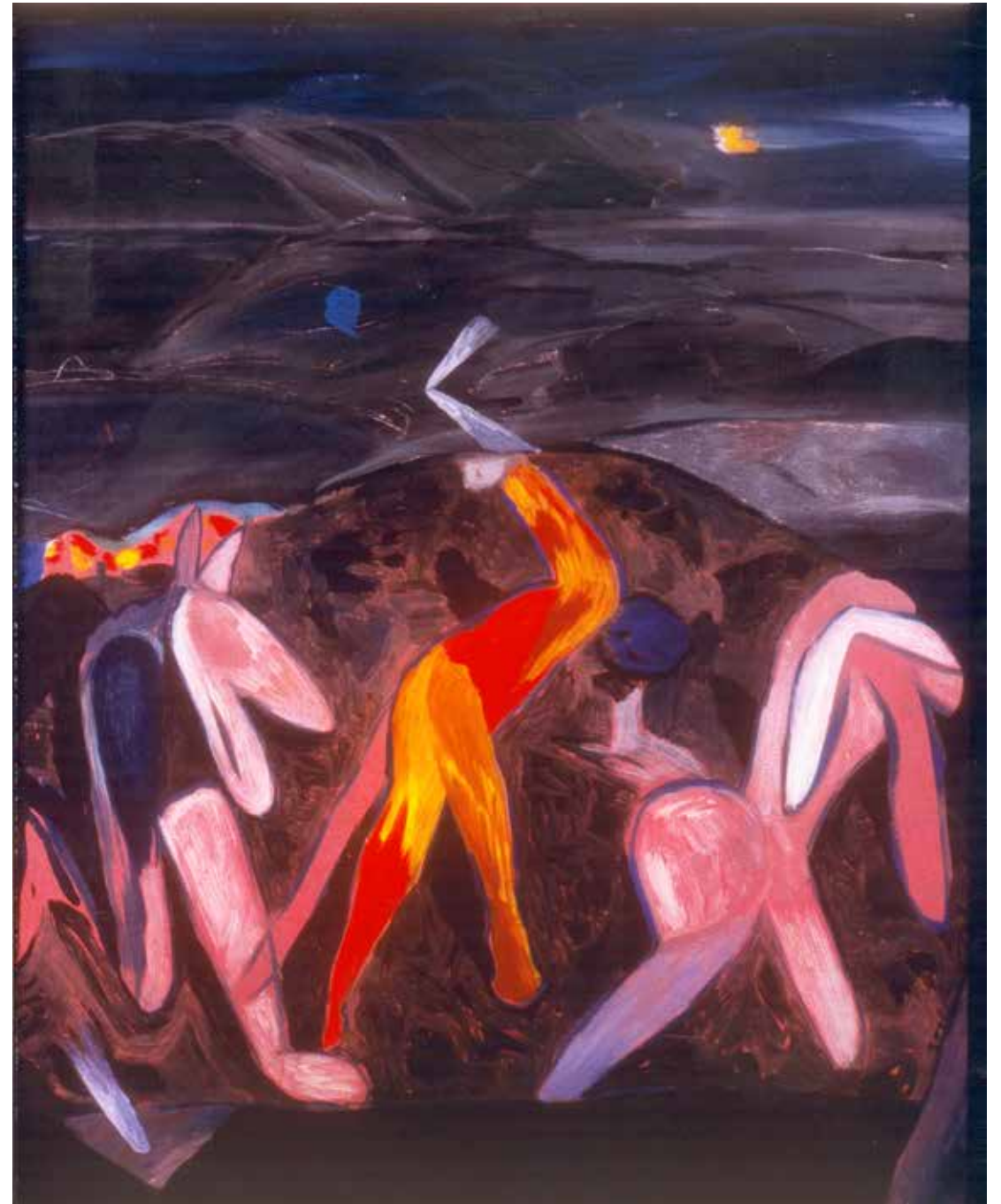
Jaktscene. 1985. Olje. 120 x 95.