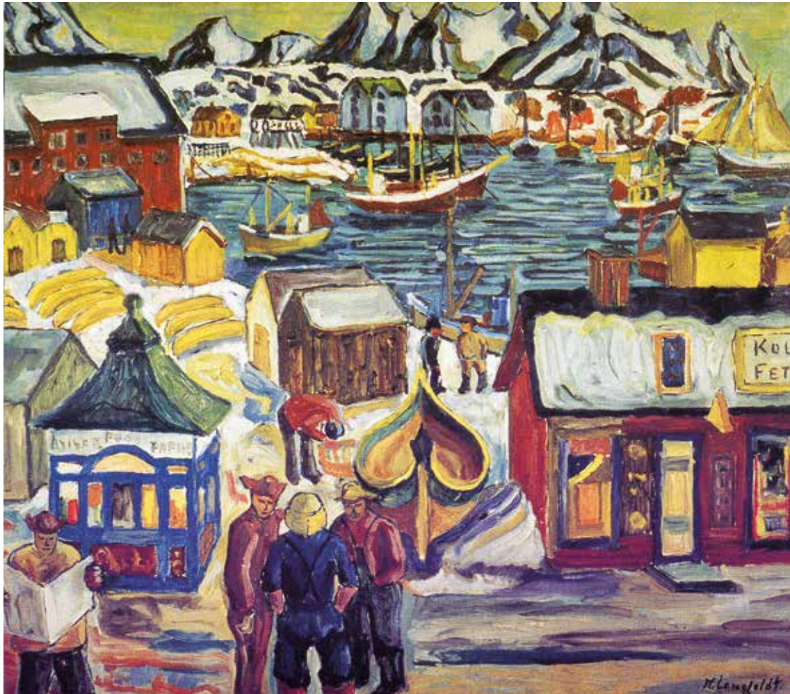
Bildet tilhører Helene Drechsler. Foto: John Stenersen.