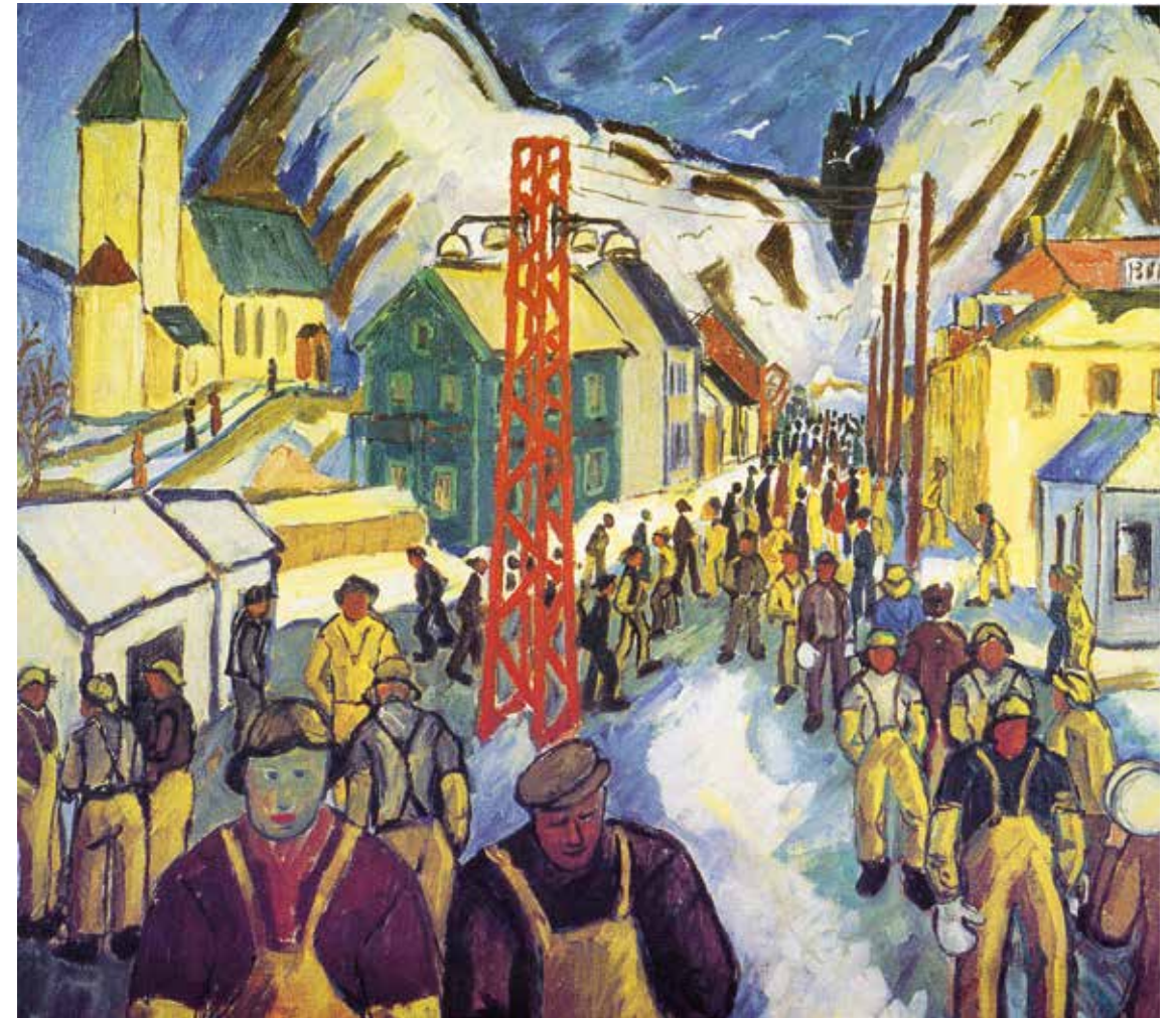
Bildet tilhører William Hakvaag. Foto: John Stenersen.